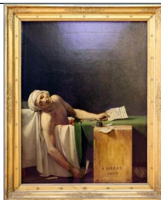
Жак Луи Давид. "Смерть Марата". 1793. Королевские музеи изящных искусств, Брюссель