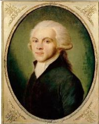
Максимилиан Робеспьер (1758-1794)