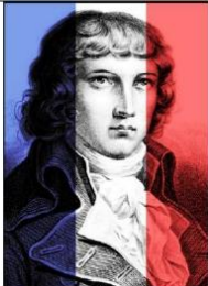
Луи Антуан Сен-Жюст (1767-1794)