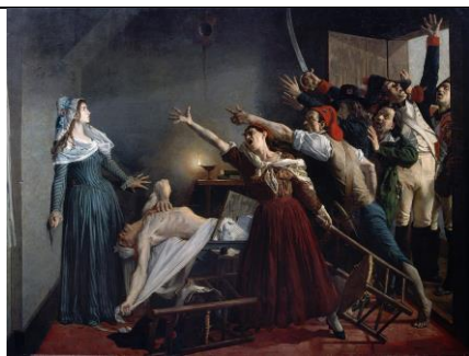
Жан-Жозеф Веертс. "Убийство Марата". 1880

Материал для работы других групп опубликован по ссылке: https://drive.google.com/drive/folders/1UOYn7akl38sOK623d-1a-caX3r59eFAa?usp=sharing .