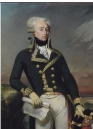
Жильбер Ла Файет (1757-1834)