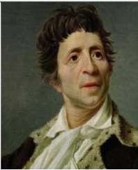
Жан-Поль Марат (1743-1793)